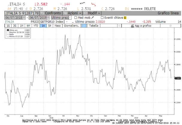
Spread Btp/Bund: andamento